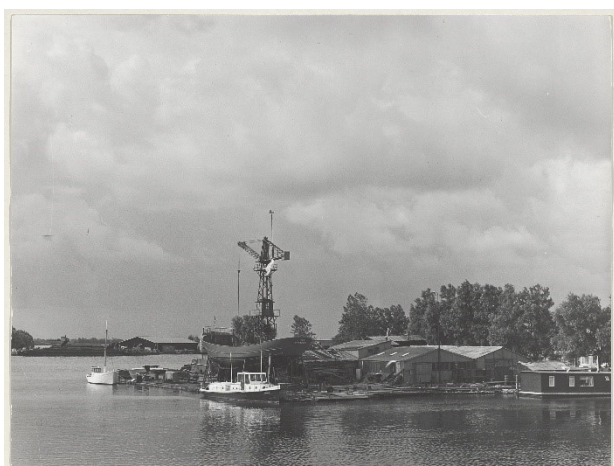
De Rietpol in 1962

Tijdens de oorlog was De Rietpol een schuiloord voor Joodse onderduikers en een opslagplaats voor wapens van het ondergrondse verzet. Na enkele invallen van de Duitse bezetter werd de brug langs het remmingwerk afgebroken. In 1944 kwam er een lage, smalle (ophaal)brug naar de Pol op dezelfde plek als de huidige verbinding.