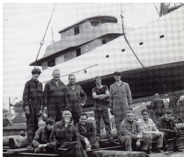
Foto personeel 1963 de Rietpol